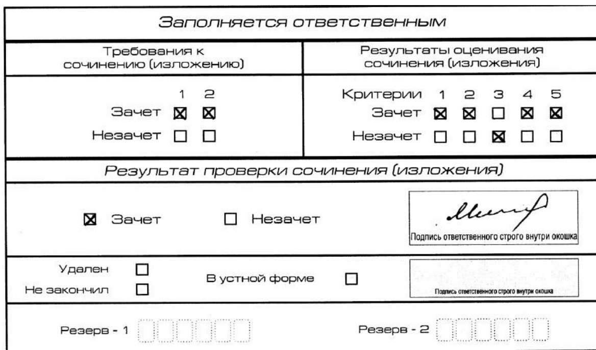
Рис. 10. Область для оценки работы

3. Во всех остальных случаях итоговое сочинение (изложение) проверяется по всем пяти критериям и оценивается по системе «зачет»/«незачет» (например, нельзя не проверять работу по критериям К4 и К5, если участник получил зачет на основании зачетов по критериям К1, К2, К3).